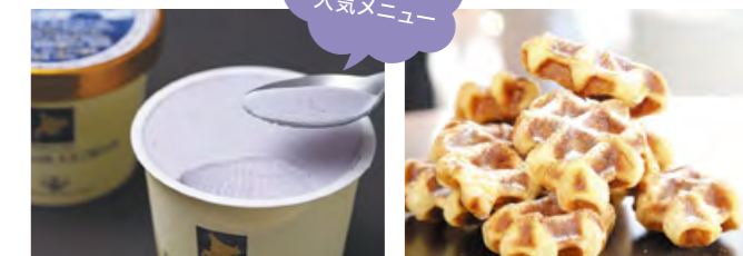
ラベンダーアイスクリーム 450円 クロッフル 160円 (テイクアウト可能)

営業時間 4月~10月/9:00~16:00 11月~3月/10:00~15:00