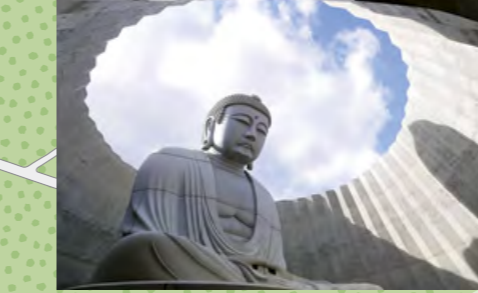
C 頭大仏殿(あたまだいぶつでん)