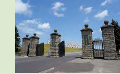
A 真駒内滝野霊園正門

お盆・秋彼岸バス乗降場所 ■ 第1期・第3期行... ② 供養橋前→③ 43区前→④ 22区前→⑤ 販売センター前→⑥ 滝之太陽殿前→⑦ 南2番地前→⑧ 東1番地前 ■ 第2期行... ⑬ 3区前→⑭ 八角堂前→⑪ 15区前→⑫ 17区前