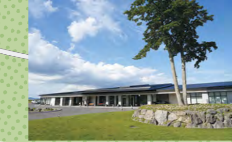
N 管理事務所(モアイ像横)