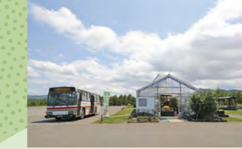
F 真108便停留所・たきの花マルシェ