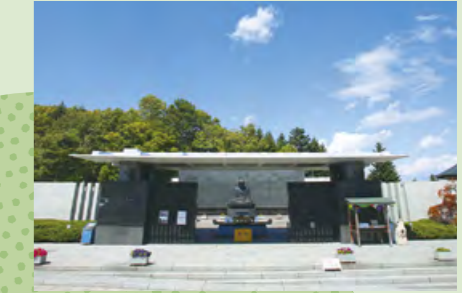
G ストーンヘンジ(永代供養墓 ※有期限制度・頭大仏御廟 合葬先)