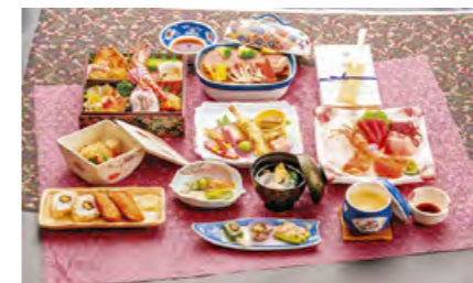
桜コース 折詰1段 SA-4 ▼

法要膳(SA-1) 11,880円 折詰1段(SA-4) 4,900円 法要膳(SA-2) 9,460円 折詰2段(SA-5) 8,250円 法要膳(SA-3) 6,900円 子供膳(SA-6) 2,420円