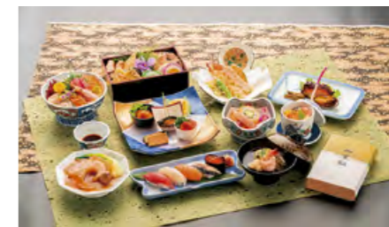
藤コース 折詰2段 FU-4 ▼

法要膳(FU-1) 15,400円 折詰2段(FU-4) 6,000円 法要膳(FU-2) 12,000円 折詰3段(FU-5) 12,000円 法要膳(FU-3) 8,000円 子供膳(FU-6) 3,000円