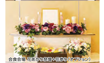
会食会場 花あかり祭壇+花参り(オプション)