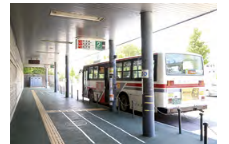
地下鉄真駒内駅前バスのりば②番