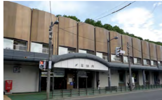
地下鉄真駒内駅(南北線 真駒内方面終点)

真駒内滝野霊園の最寄駅は、地下鉄南北線『真駒内駅』です。真駒内駅までは、地下鉄以外でも『大谷地駅』や『福住駅』から路線バスが運行しています。真駒内駅からは『墓参バス』や路線バス『真108便』に乗換え、約20～23分で真駒内滝野霊園に到着します。