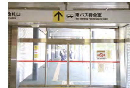
地下鉄真駒内駅(南側出口)