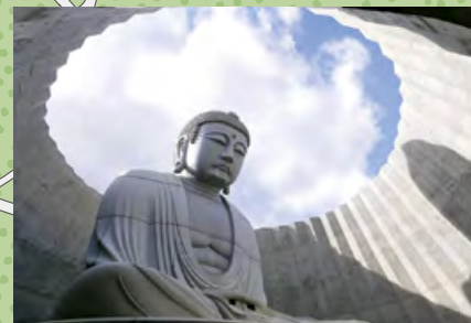
C 頭大仏殿(あたまだいぶつでん)