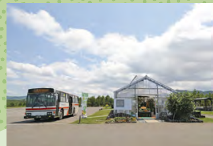
真108便停留所・たきの花マルシェ