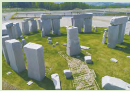
G ストーンヘンジ(永代供養墓 ※有期限制度・頭大仏御廟 合葬先)