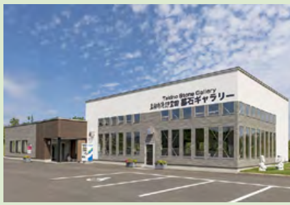
J 墓所・墓石販売センター 墓石ギャラリー