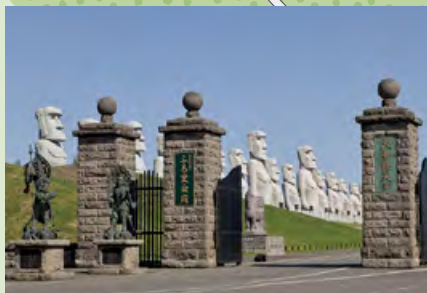
A 真駒内滝野霊園正門

※ 路線バス(真108便)は ⑭ 頭大仏前が終点です。墓参の場合は園内便へ乗換えてください。