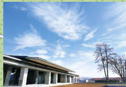
N 新管理事務所(モアイ像横)