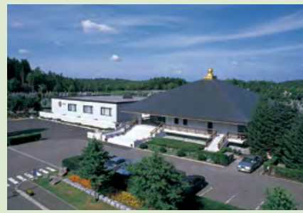
K 滝之太陽殿(旧管理事務所)