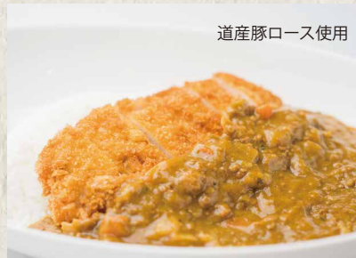
道産豚ロース使用 カツカレー ¥ 950 KATSU CURRY