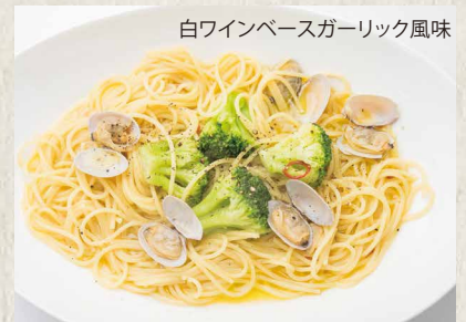
白ワインベースガーリック風味 ボンゴレ ¥ 800 VONGOLE