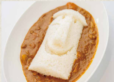
モイクンカレー ¥ 700 CURRY RICE

お米は全て北海道産のブレンド米を使用しています。 カレーは弱火でじっくり仕込みました。