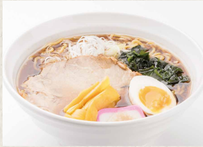
醤油ラーメン ¥ 750 SOY-SAUCE RAMEN