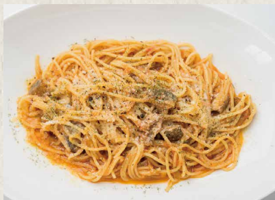
彩り野菜のカポナータ ¥ 800 CAPONATA