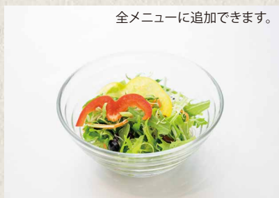
全メニューに追加できます。 サラダ ¥ 150 SALAD