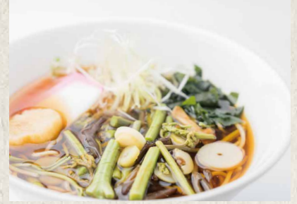
山菜そば・うどん ¥ 700 WILD VEGETABLE SOBA