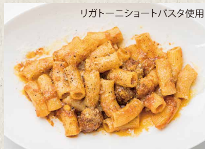
リガトーニショートパスタ使用 ボロネーゼ ¥ 800 BOLOGNESE