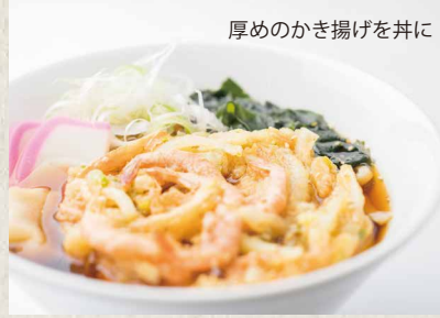
厚めのかき揚げを丼に かき揚げそば・うどん ¥ 700 KAKIAGE SOBA