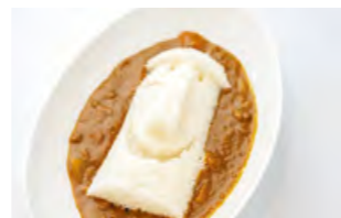
モイクンカレー 700円

公式キャラクターのモイクンがカレーになりました。 御膳の内容は季節により変わります。 まに人気があります。