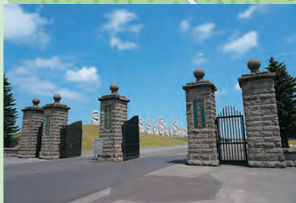
A 真駒内滝野霊園正門