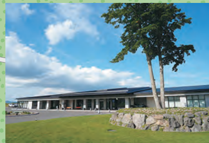
N 管理事務所(モアイ像横)