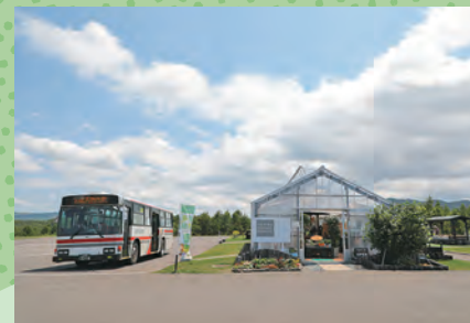
F たきの花マルシェ・真108便停留所