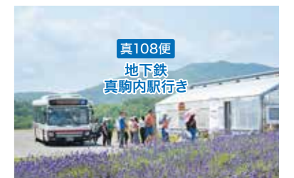
真108便頭大仏前停留所

真106便地下鉄真駒内駅行きのバス停付近には信号がありません。道路を横断する際は、周囲の安全を十分に確認してください。