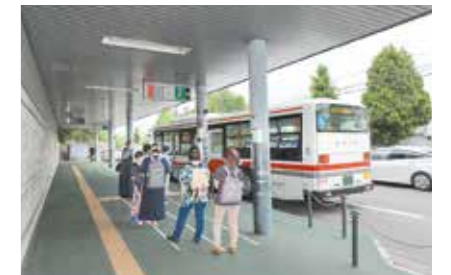
地下鉄真駒内駅②番のりば