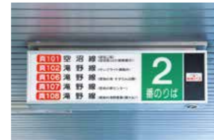
地下鉄真駒内駅②番のりばサイン