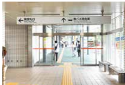
地下鉄真駒内駅(南側出口)