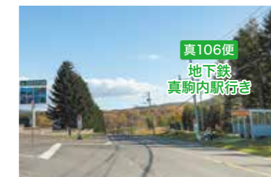
真106便滝野峠停留所