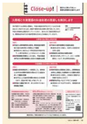
▲広報さっぽろ2024年6月号から抜粋