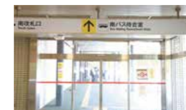
地下鉄真駒内駅(南側出口)

真108便の時刻表やのりばなどの詳細は別紙 冊だよりNo.56をご参照してください。