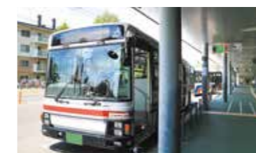
地下鉄真駒内駅前③番のりば