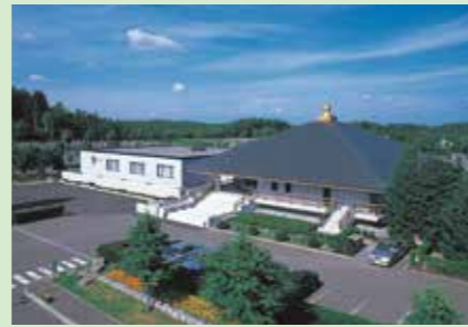
K 滝之太陽殿(旧管理事務所)