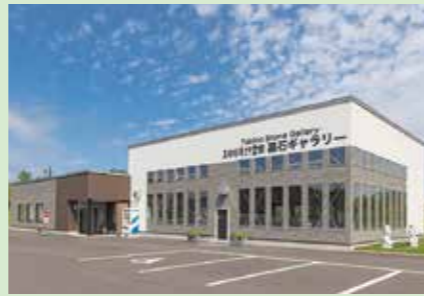
J 墓所・墓石販売センター 墓石ギャラリー