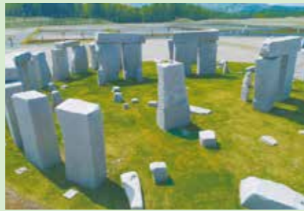
G ストーンヘンジ(永代供養墓) ※有期限制度・頭大仏御廟 合葬先