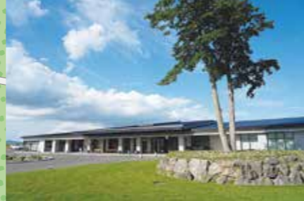
N 管理事務所(モアイ像横)