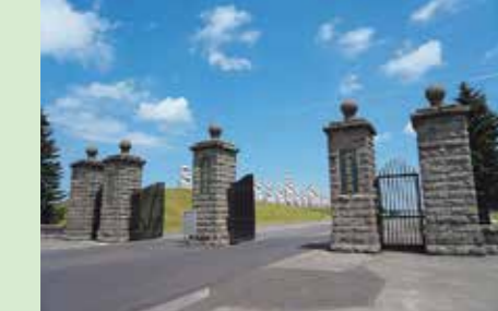
A 真駒内滝野霊園正門