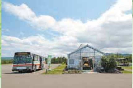
F たきの花マルシェ・真108便停留所