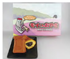
モイクンおやき 800円 (6コ入り)