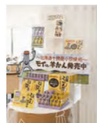
モイクンようかん 1,250円 (6コ入り)